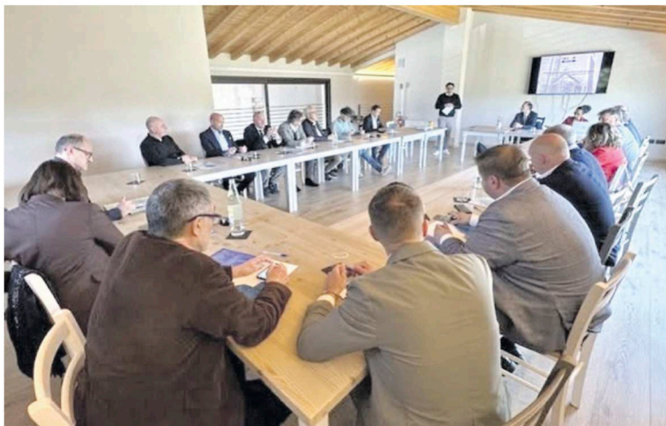
TAVOLO DI CONFRONTO I sindaci degli undici Comuni del Portogruarese e i rappresentanti delle categorie economiche durante l'incontro

Nel corso del vertice è stato esaminato in particolare uno studio della Cgia di Mestre, che ha messo in luce, tra le altre cose il calo demografico del man-