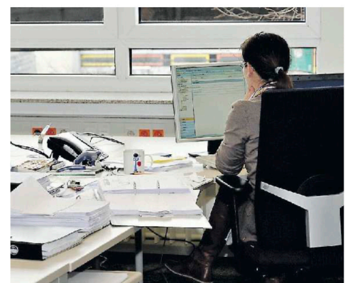
RUOLO DELICATO Nella provincia di Belluno mancano 12 segretari

segretari comunali. «Un segretario di prima nomina costa tra 86.000 e 100.000 euro annui - spiega il primo cittadino - una spesa insostenibile per i piccoli comuni. Noi, ad esempio, disponiamo solo di 18.000 euro per questa voce a causa dei limiti sulla spesa del personale, e quindi c'è la convenzione tra Comuni, per dividere i costi, che è però una soluzione complessa e precaria, in quanto vincolata da due limiti normativi: la capacità finanziaria complessiva per coprire lo stipendio e il tetto massimo di abitanti gestibili dal segretario (3.000, con deroga temporanea a 5.000 per il Pnrr). Trovare comuni che soddisfino entrambi i requisiti è un terno al lotto. Noi siamo messi che lo scorso anno abbiamo firmato una convenzione con quattro Comuni, ma il Comune capofila ha rescisso la convenzione così siamo ancora a piedi».