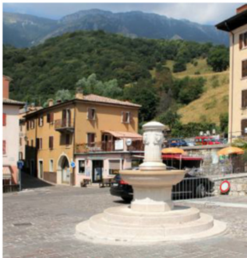
La piazza di Ferrara di Monte Baldo

Una analisi che, non a caso, è stata fatta mentre la Regione si trova in zona arancione, con tutte le restrizioni che ne conseguono, prima fra tutti l'impossibilità di uscire dai confini comunali se non per necessità, salute, lavoro. Tra le poche deroghe previste e in vigore dal «decreto Natale», quella appunto che riguarda i Comuni sotto i 5mila abitanti, che possono allontanarsi per massimo 30 chilometri. Per fortuna, verrebbe da dire, considerando che senza questa opportunità molti cittadini si troverebbero in forte difficoltà. In particolare quelli di Ferrara di Monte Baldo, paese che nell'indagine della Fondazione si trova nel ristretto grup-