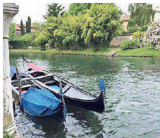
Le due gondole sul Lemene

È questa una delle grandi novità di "Terre dei Dogi in festa" la grande fiera che verrà inaugurata alle 18 di venerdì con la tradizionale apertura della Porta di San Giovanni per terminare domenica sera. Sabato e domenica si terrà anche nel parco di villa comunale la Fiera del biologico. I costumi d'epoca per Terre dei Dogi 2017 sono stati