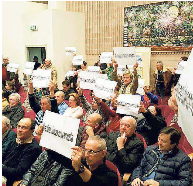
Una protesta dei residenti contrari al passaggio dall'Usl 3 all'Usl 4

La Regione, si legge nella nota ufficiale, si è impegnata a garantire le risorse economiche per confermare la continuità dei servizi attualmente erogati e a mettere a disposizione le risorse necessarie per attivare il nuovo punto di primo intervento. «A tutela dei nostri cittadini»