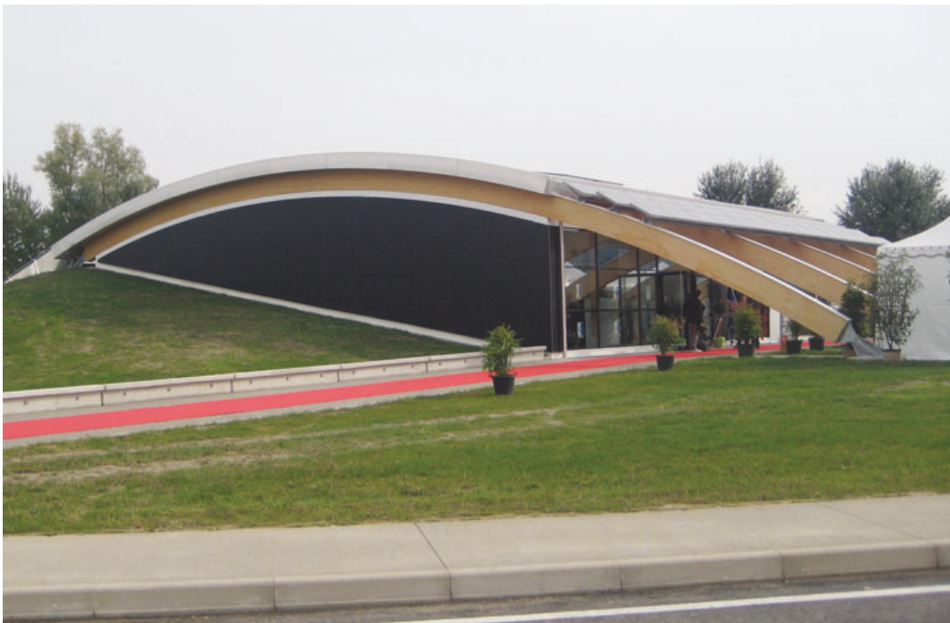
La Palazzina del Polins nell'area East Park Pirelli Re

INNOVAZIONE «Stiamo già lavorando per riavviare l'attività del polo che è stata ferma per un po' - spiega Innocente - . Il focus è l'innovazione tecnologica delle imprese, in particolare il tema è quello dell' innovazione tecnologica, ma anche informatica, dei